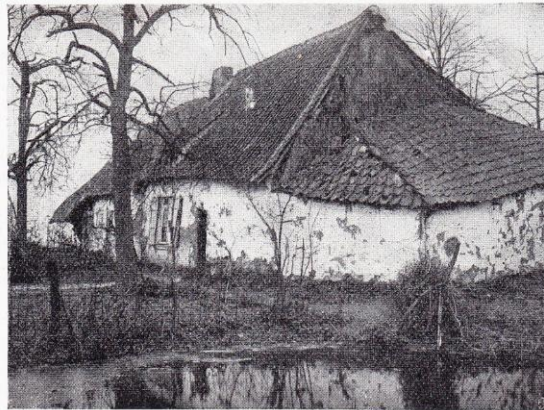
Humbeek. — Masures dans la Drieschstraat.

De fait, ces Belges d'il y a vingt siècles n'en avaient pas moins déjà l'esprit national très développé; puisque, pour repousse